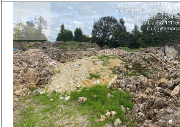
Fotografía 3. Punto de acopio y disposición de Residuos de Construcción y Demolición – RCD mezclados, como cantos y piedras.