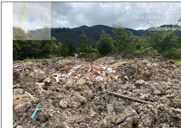
Fotografía 5. Punto de acopio y disposición de Residuos de Construcción y Demolición – RCD mezclados, como cantos, PVC, ladrillos, madera y cerámicos.