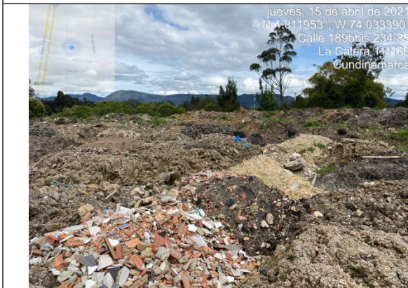
Fotografía 7. Punto de acopio y disposición de Residuos de Construcción y Demolición – RCD mezclados, como cantos, PVC, ladrillos, madera y cerámicos