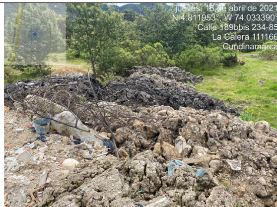
Fotografía 8. Punto de acopio y disposición de Residuos de Construcción y Demolición – RCD mezclados.