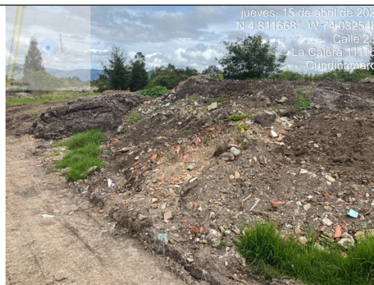
Fotografía 2. Punto de acopio y disposición de Residuos de Construcción y Demolición – RCD mezclados, como cantos y ladrillos.