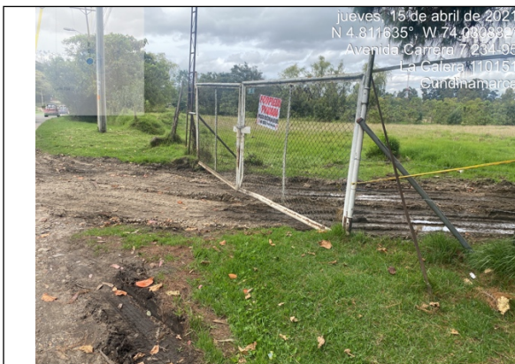
Fotografía 1. Entrada parqueadero ubicado en cerca de la avenida carrera 7 No. 234 – 85 IN 1.