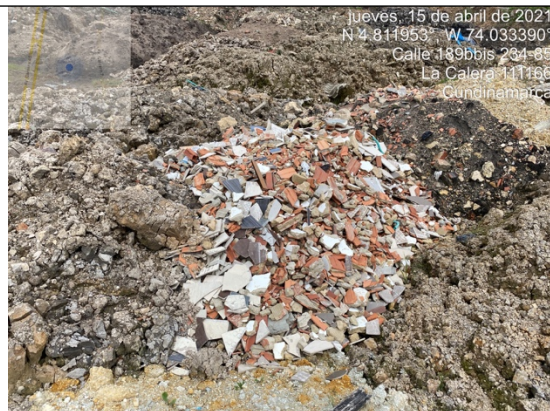
Fotografía 6. Punto de acopio y disposición de Residuos de Construcción y Demolición – RCD mezclados, como cantos, PVC, ladrillos, madera y cerámicos.