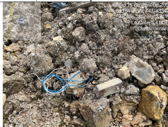
Fotografía 4. Punto de acopio y disposición de Residuos de Construcción y Demolición – RCD mezclados.